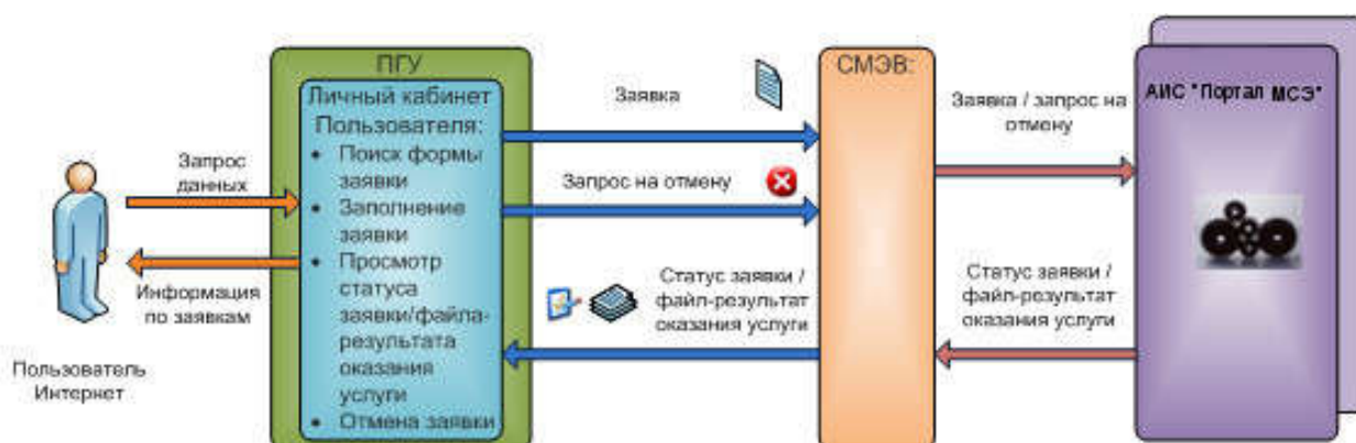
Рисунок 10 Схема взаимодействия ЕПГУ и АИС «Портал МСЭ»

Схема взаимодействия ЕПГУ и АИС «Портал МСЭ» представлена на Рисунках 10-11