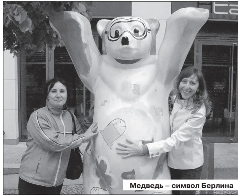
Медведь – символ Берлина