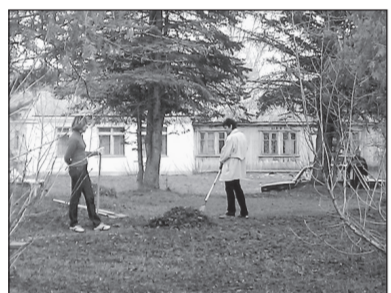
В конце апреля в КБ № 50 прошел традиционный весенний субботник. Сотрудники всех подразделений больницы – 750

человек! – приняли участие в наведении чистоты и порядка на прикреплённых территориях общей площадью 20 га. Для справки: всего территория КБ № 50 составляет 33 га. Собранный мусор, сухие ветки деревьев и листва, – всего около 30 тонн, – упаковывалось в специальные мешки и вывозилось на полигон бытовых отходов. По мнению руководства административно-хозяйственной службы, все, кто вышел на субботник, работали качественно и ответственно.