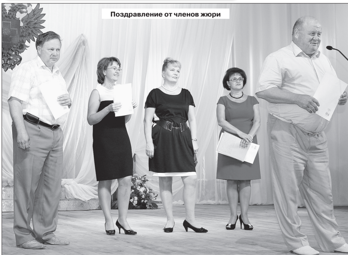
Поздравление от членов жюри