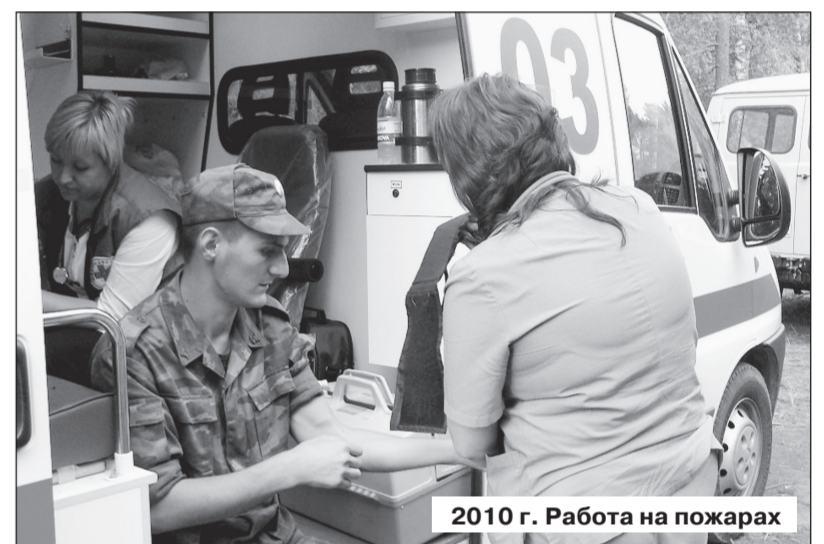
2010 г. Работа на пожарах