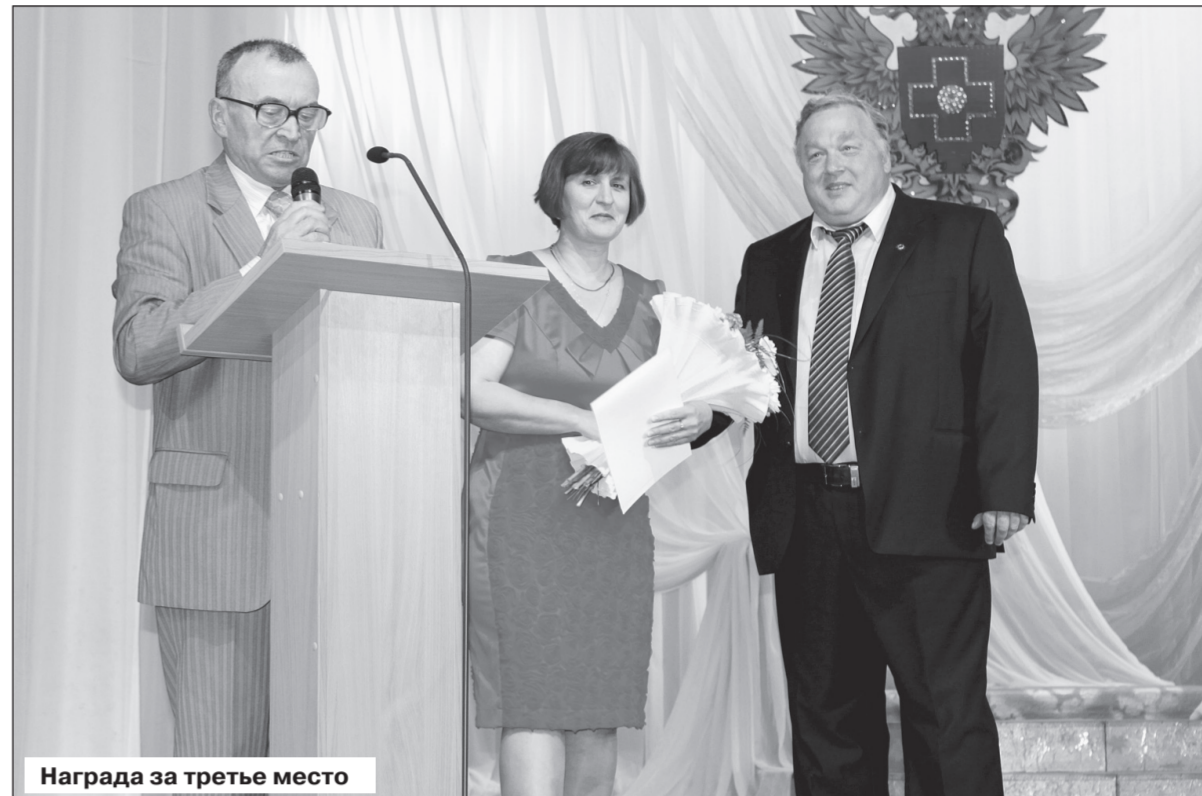
Награда за третье место

Денежные средства для награждения отличившихся в смотре-конкурсе выделены: ППО РП РАЭП РФЯЦ-ВНИИЭФ – для награждения коллективов отделения медицинской профилактики и цехово-терапевтического отделения поликлиники № 2 – по 25 тыс. рублей. заместителем председателя городской Думы – для награждения коллектива операционного блока – 20 тыс. рублей.