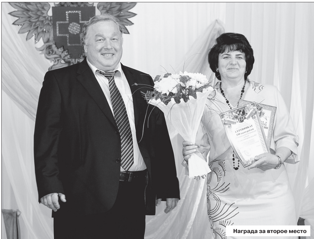
Награда за второе место