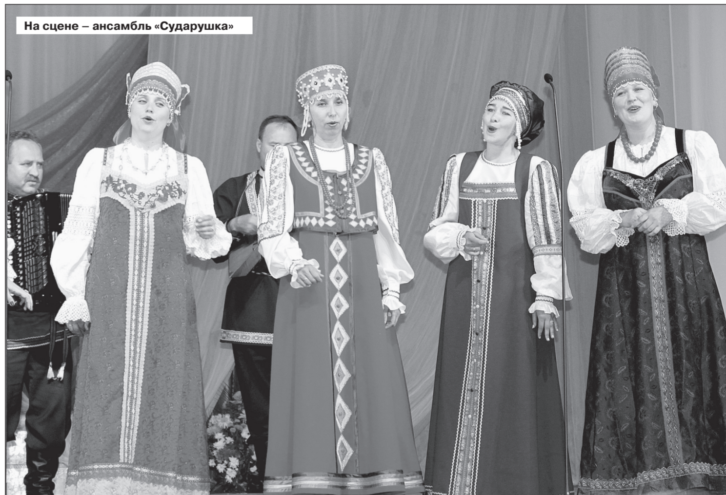
На сцене – ансамбль «Сударушка»