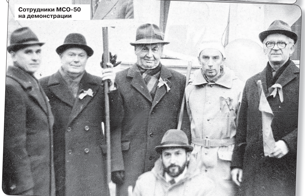
Сотрудники МСО-50 на демонстрации