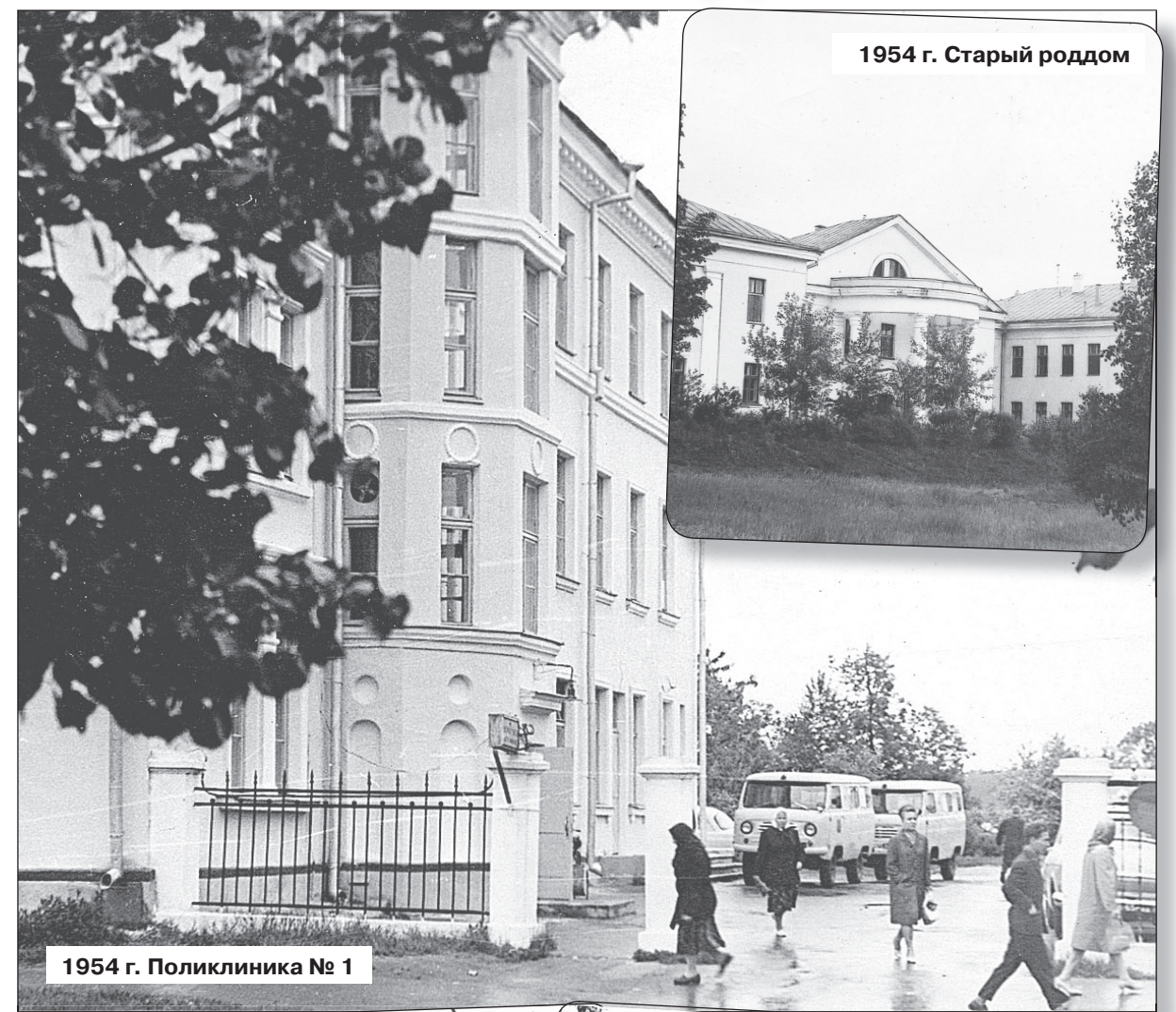
1954 г. Старый роддом