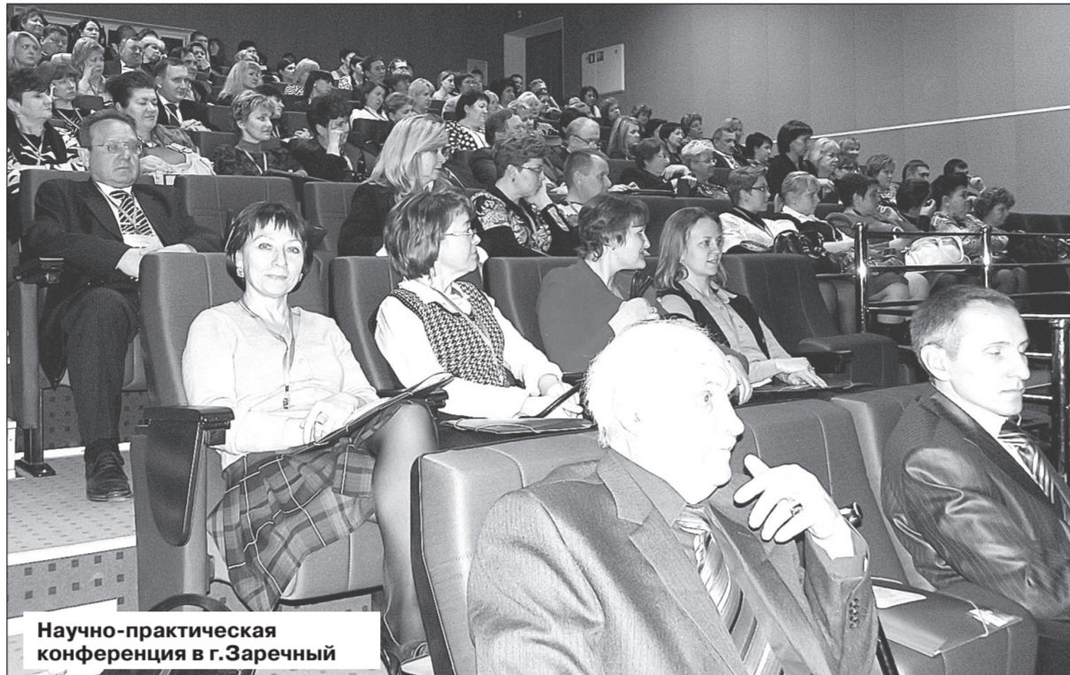
Научно-практическая конференция в г.Заречный

Другая составляющая – это четко прописанная двухуровневая система профилактики. На первом уровне все учреждения, занимающиеся выявлением семей находящихся в социально опасном положении, направляют информацию в единый центр, которым руководит заместитель главы города. Вся полученная информация обрабатывается, и по каждому конкретному случаю выносятся решение о включении объекта профилактической работы в ту или иную программу первичной профилактики. На втором уровне, на основании Федерального закона №120-ФЗ, происходит формирование муниципального учета семей, находящихся в социально опасном положении, межведомственный полипрофессиональный консилиум разрабатывает индивидуальные программы реабилитации. Эта работа построена на принципе обратной связи – все изменения в статусе объектов профилактики фиксируются и возвращаются в комиссию, где осуществляется контроль реализации профилактических программ и их коррекция. И третья составляющая успеха – это кадровая политика. Все учреждения, работу которых нам удалось посмотреть, были укомплектованы не просто всеми необходимыми