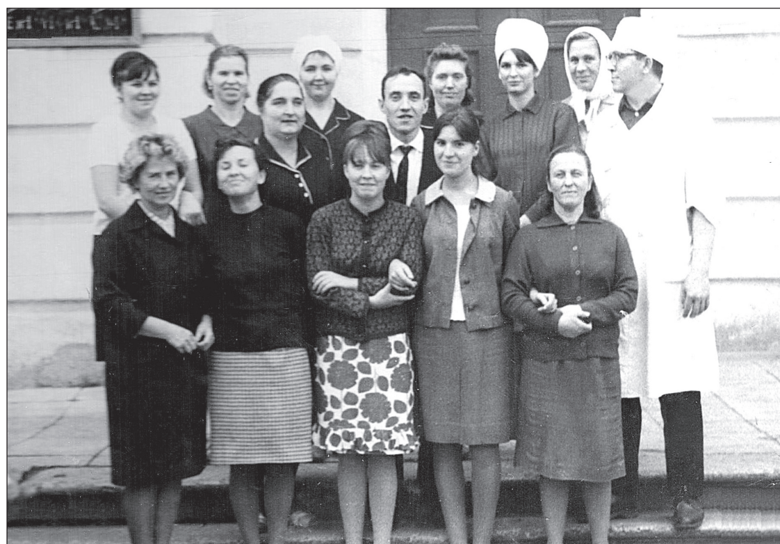
День открытия урологического отделения