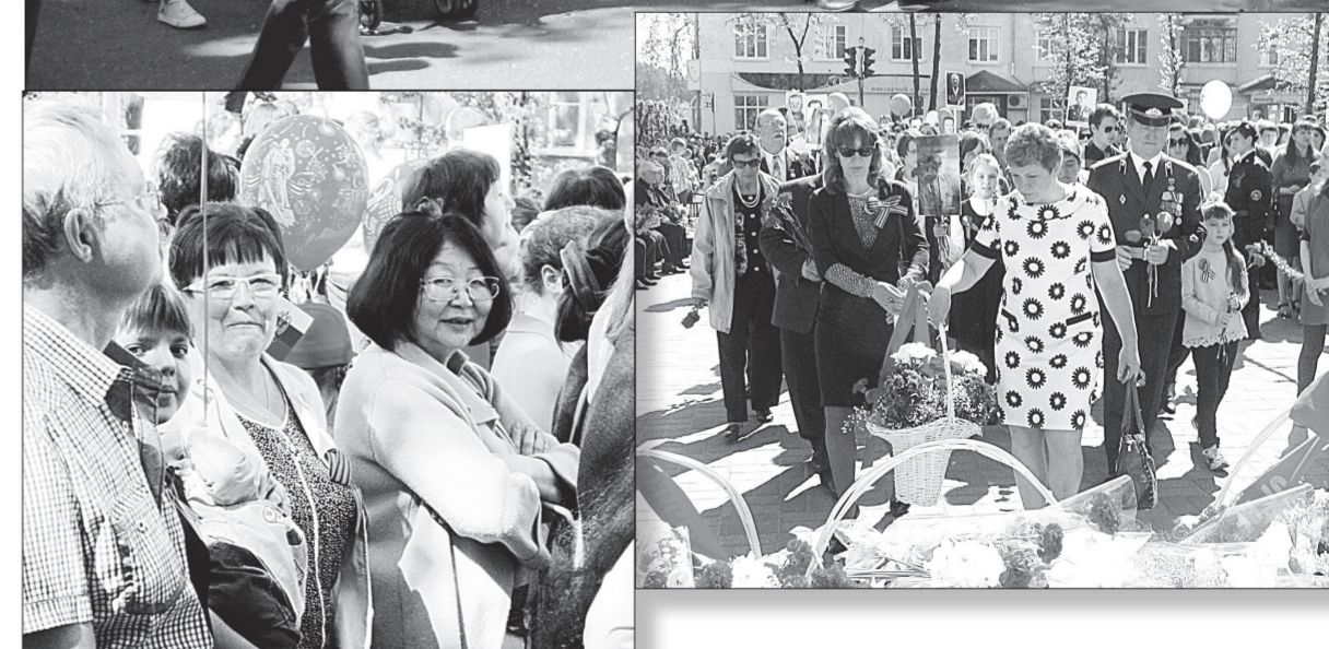
Фото сотрудников КБ № 50