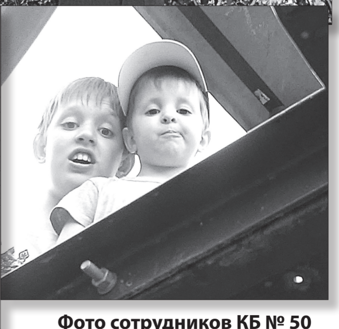
Фото сотрудников КБ № 50