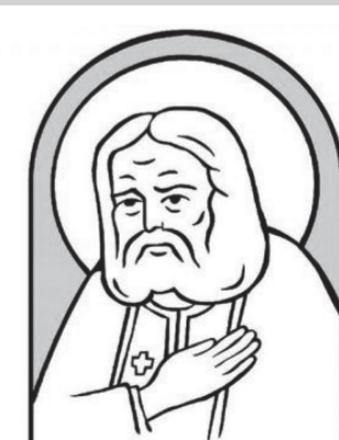
ФОНД ПРЕПОДОБНОГО СЕРАФИМА САРОВСКОГО