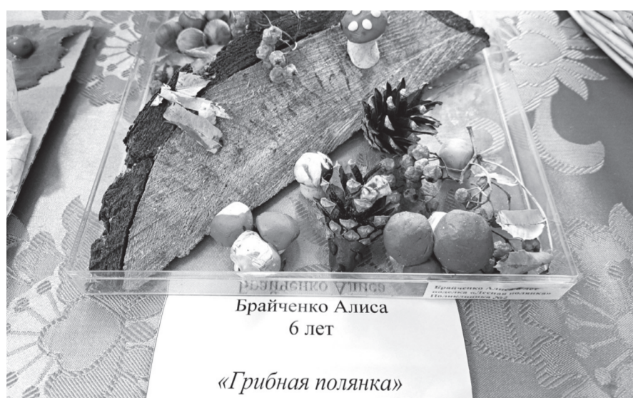
Брайченко Алиса 6 лет «Грибная полянка»