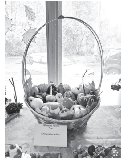
Мозин Захар 9 лет «Осенняя фантазия»