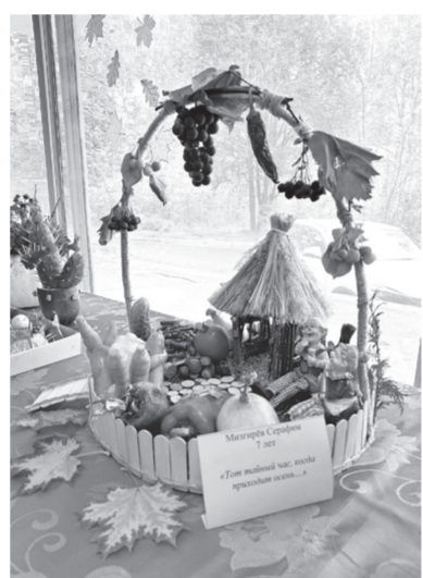
Кимяева Софья 14 лет «Осенняя фантазия»