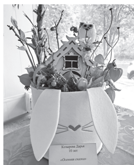
Коларова Дарья 10 лет «Осенняя сказка»