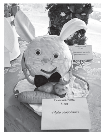
Семиков Рома 5 лет «Нужно сплести»