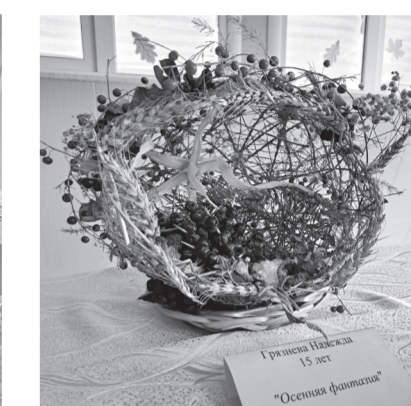
Гришан Наталья 15 лет «Осенняя фантазия»