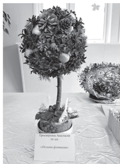
Кимяева Софья 14 лет «Осенняя фантазия»